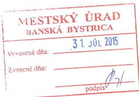
Ján Nosko primátor mesta Banská Bystrica