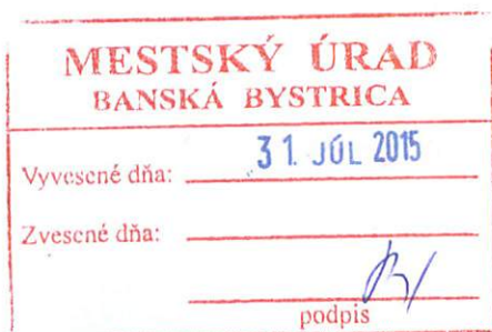
Ján Nosko primátor mesta Banská Bystrica