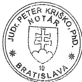
Ivana Csáderová pracovník poverený notárom

Upozornenie! Notár legalizáciou neosvedčuje pravdivosť skutočností uvádzaných v listine (§58 ods. 4 Notárskeho poriadku)