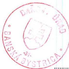
Mgr. Monika Strážovcová vedúci oddelenia správy daní 2

Toto oznámenie sa vyvesuje po dobu 15 dní. Podľa § 35 ods. 2 zákona č. 563/2009 Z. z. v znení neskorších predpisov posledný deň tejto lehoty sa považuje za deň doručenia.